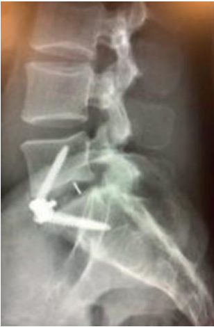
Bild 3. Röntgenbild efter operation med ALIF