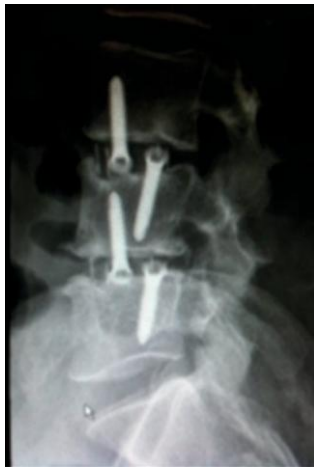
Bild 4. Röntgenbild efter operation med XLIF