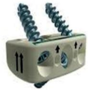
Bild 7. PEEK bur