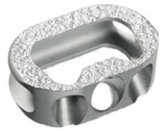
Bild 6. Metallbur